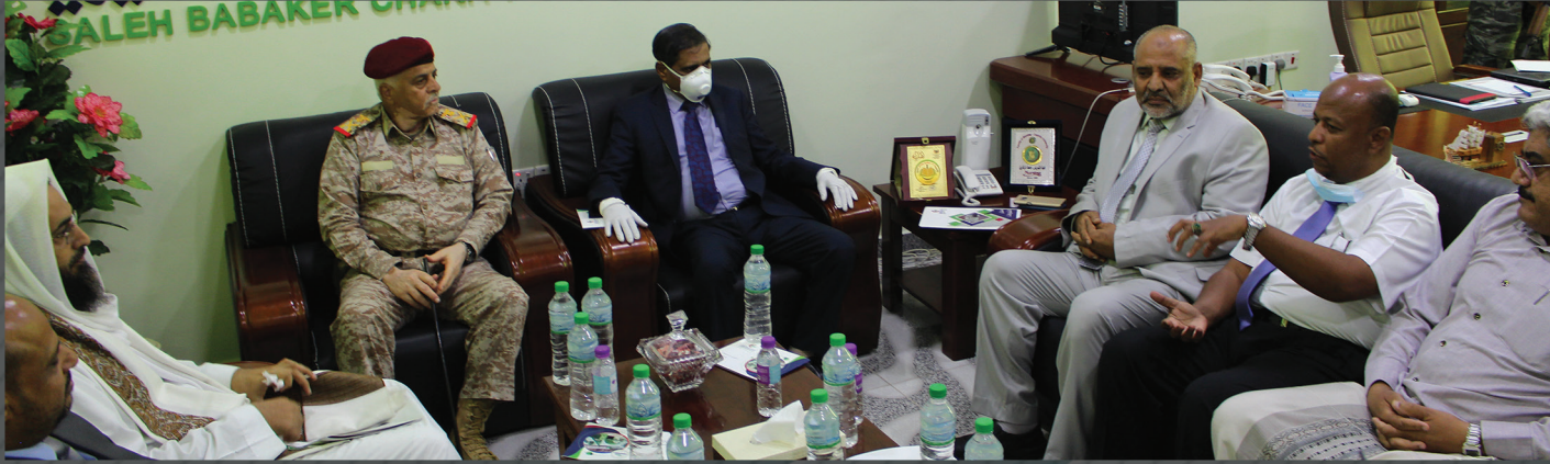
زيارة محافظ محافظة حضرموت قائد المنطقة العسكرية الثانية اللواء الركن / فرج سالمين البحسني .. رفقة عدد من الشخصيات الرسمية