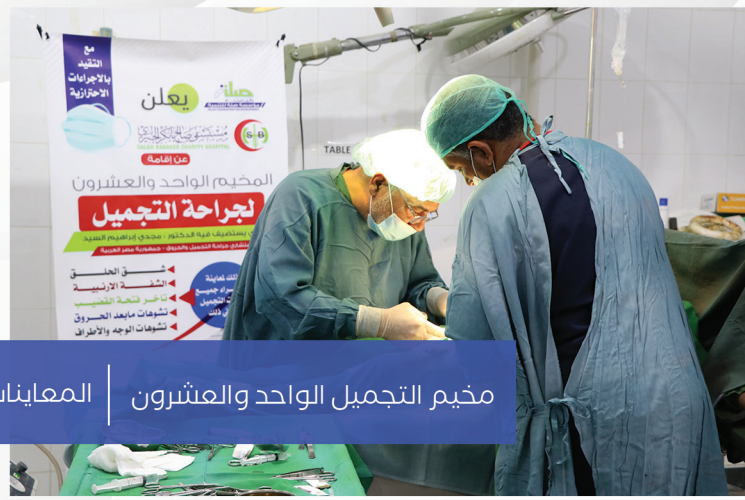
مخيم التجميل الواحد والعشرون | المعاینات 112 العمليات 71