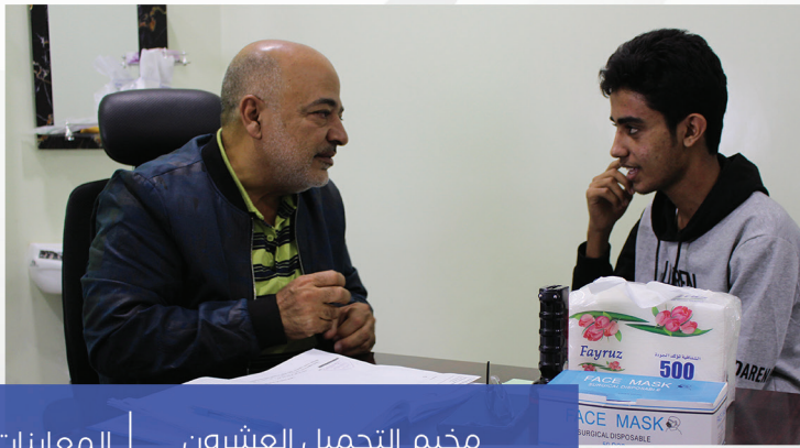
مخيم التجميل العشرون | المعاینات 100 العمليات 82