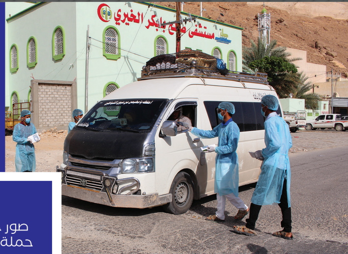
صور جهود حملة كورونا